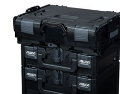
BS Systems L-Boxx