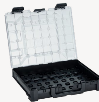
metaBox M95 Varenr. 114876

Udvendige mål (BxDxH): 440 x 346 x 95 mm, indvendige mål (BxDxH): 417 x 314 x 58 mm, vægt: 1,52 kg