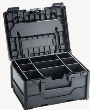
metaBox Divider S215 Varenr. 114909