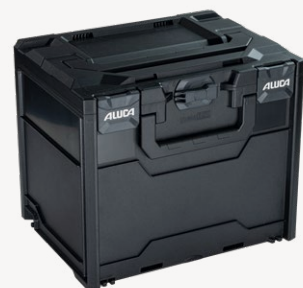
metaBox S340 Varenr. 114875

Udvendige mål (BxDxH): 396 x 296 x 340 mm, indvendige mål (BxDxH): 379 x 268 x 305 mm, vægt: 2,51 kg, kuffertvolumen: 31,0 l, maks. belastning låg: 125 kg, materiale: ABS