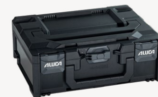
metaBox M145 Varenr. 114877

Udvendige mål (BxDxH): 496 x 346 x 145 mm, indvendige mål (BxDxH): 429 x 317 x 110 mm, vægt: 1,95 kg, kuffertvolumen: 14,1 l, maks. belastning låg: 125 kg, materiale: ABS