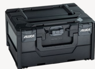
metaBox S215 Varenr. 114874

Udvendige mål (BxDxH): 396 x 296 x 215 mm, indvendige mål (BxDxH): 379 x 268 x 180 mm, vægt: 1,92 kg, kuffertvolumen: 18,3 l, maks. belastning låg: 125 kg, materiale: ABS