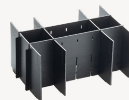
metaBox Divider M145 Varenr. 114911