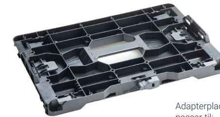
Adapterplade metaLink passer til:

Med adapterpladen metaLink kan andre kuffertssystemer uden problemer integreres i ALUCA-systemet. Adapterpladen er udstyret med særlige tilslutninger, som gør det muligt at forbinde forskellige kuffertssystemer. Adapterpladen passer til kuffertssystemer af mærkerne DeWalt TSTAK, Festool T-LOC, HiKOKI HIT-System, BS Systems L-Boxx og Makita MAKPAC. Den udmærker sig ved en holdbar og let konstruktion. Derudover kan adapterpladen også anvendes som organisator til smådele, ideelt til bits og skruer.